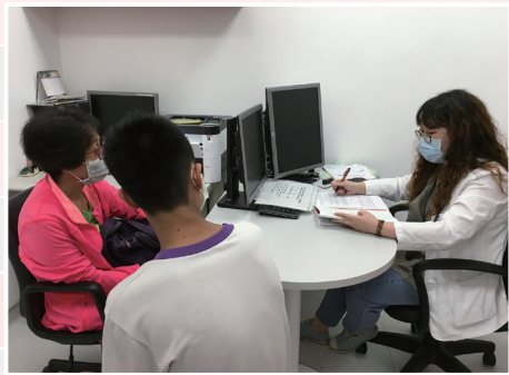
本院專業人員評估病人日常生活及社交能力。