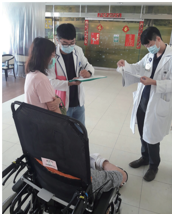
本院主治醫師評估病人功能障礙程度。

「身心障礙鑑定」主要以團隊方式進行鑑定與需求評估，不僅關心身心障礙者的生理狀況，同時也重視其日常活動與生活需求，深入瞭解其可能遭遇的各種阻礙與不便，並依個別