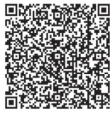
新北市立案 老人福利機構名冊

當病況嚴重且預期無法返家照顧時，「出院準備個案師」可提供住家鄰近安養護理機構名單供家屬自行接洽，請務必親自實地參訪機構並衡量機構利弊，例如：交通便利性、照顧品質、醫療設備、費用等，是否能符合期待，最後確認入住機構時，需先請醫療團隊準備「出院病歷摘要」及「感染管制所需的檢體報告」後入住。