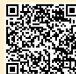
新北市政府衛生局 長照服務申請及流程