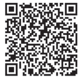
新北市 輔具資源中心

具備長照身分，政府提供補助購買生活輔具，3年補助4萬，請聯繫「長照個案管理師」或洽詢戶籍地輔具資源中心。