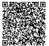
恩主公醫院 出院準備服務手冊 電子書