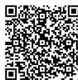
勞動部 勞動力發展署

若有任何問題，請上網至「勞動部勞動力發展署」網站查詢相關資訊，或撥打洽詢電話：(02) 8995-6000。