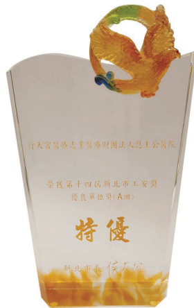
本院榮獲第14屆新北市工安獎「優良單位獎（A組）特優」

在臨床服務與醫療品質方面，本院於「一三年癌症防治績優醫療院所暨防癌尖兵表揚典禮」中一舉奪下三項第一名，分別是「乳癌生命搶救王」、「肺癌品質王」與「癌症篩檢效率王」，是當年新北市表現最突出的醫療院所之一。