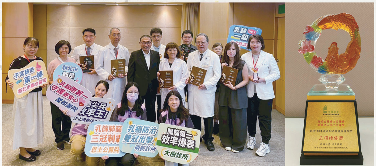
本院榮獲衛生福利部國民健康署113年癌症防治績優醫療院所「三項績優獎」

本院在預立醫療決定與安寧緩和照護方面推動多年，展現深厚能量，去年底再次榮獲一一四年預立醫療照護諮商推動績優機構感