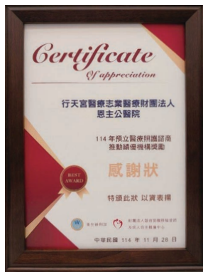
114年預立醫療諮商推動績優機構獎勵感謝狀