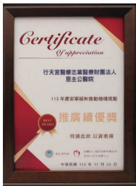
113年度安寧緩和推動機構獎勵推廣績優獎

此研究從臨床需求出發，透過標準化教材、自創記憶口訣與影片化及QR Code化的多元學習模式，使照服員的照護一致性與正確性大幅提升。湯護理長站上國際舞臺，不只代表個人，也代表恩主公醫院在病人安全、實證研究與品質改善上的深厚實力，讓世界看見臺灣區域醫院的專業能量。