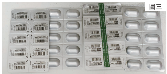
▲ Praxada（普栓達），左為110mg，右為150mg（中間貼上綠線，便於識別）