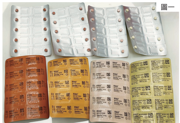
▲ Xarelto（拜瑞妥），由左而右依次為20mg /15mg /10mg /2.5mg

會根據病況一日服用一次或兩次。Xarelto（拜瑞妥）和Lixiana（里先安）為錠劑，可以整顆服用；Praxada（普栓達）為膠囊，不可打開倒出粉末服用，病人如果有吞嚥困難，可